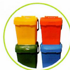
NÁDOBY NA TRIEDENIE ODPADU