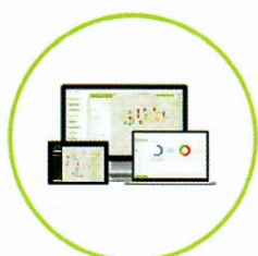
EVIDENČNÉ SYSTÉMY / ELVIS /