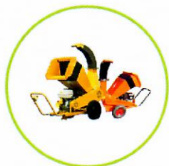
ŠTIEPKOVAČE A DRVIČE