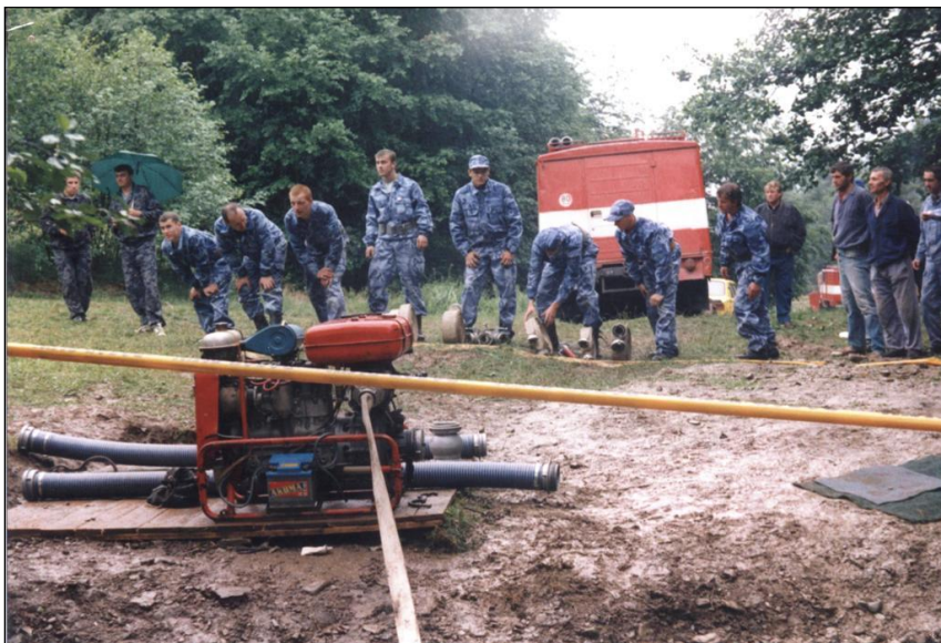
Družstvo mužov 75. výročie DHZ r. 2000