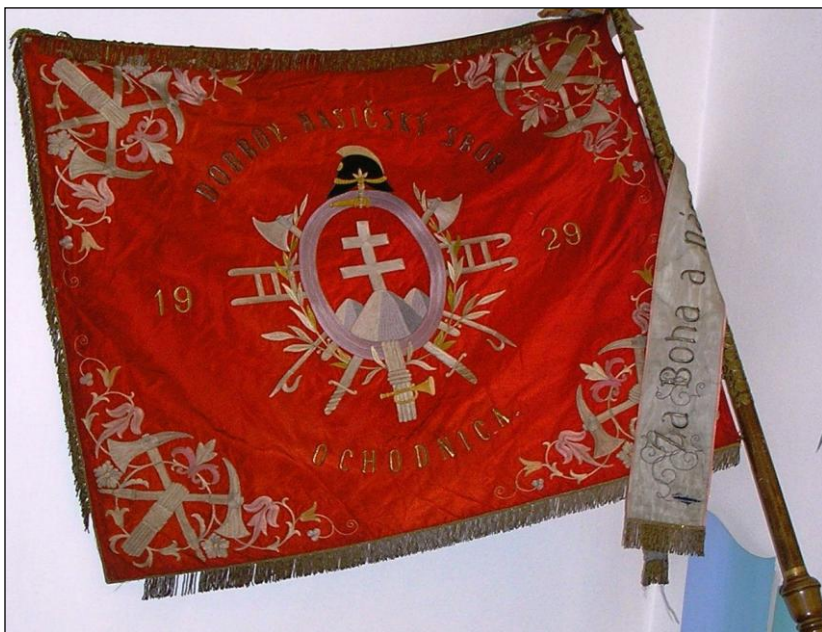
Historická zástava Hasičského zboru Ochodnica ( venovaná grófom Gejzom Csáky )