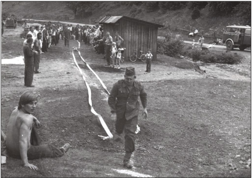
Hasičské cvičenie v minulosti – Ochodnica vyšný koniec