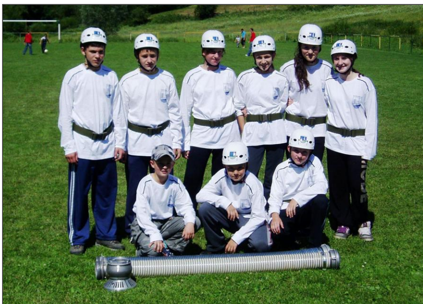
Družstvo žiakov r. 2010