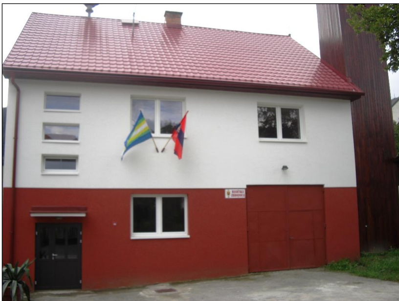
Hasičská zbrojnica rok 2010