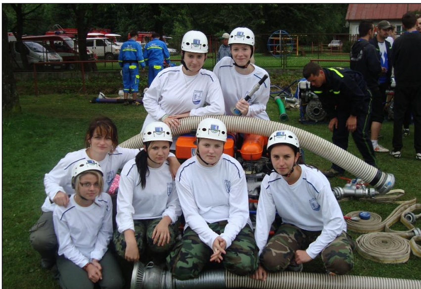
Družstvo žien r. 2010