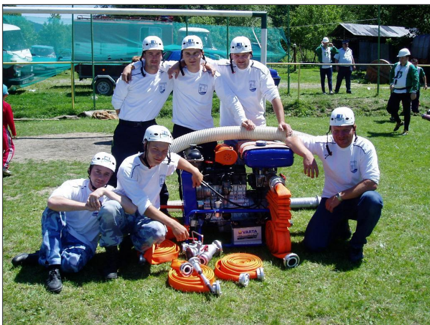
Družstvo mužov r. 2010