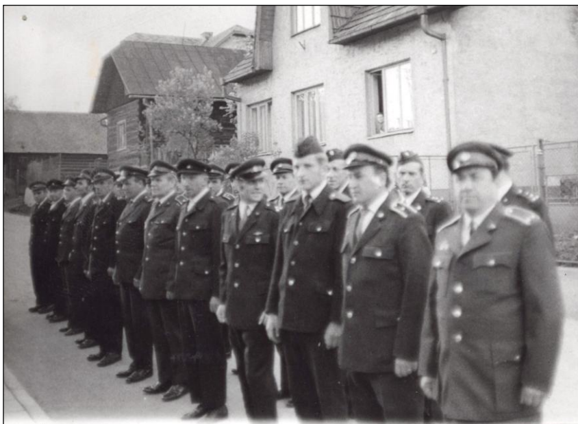
Nástup hasičov v minulosti pred budovou obecného úradu