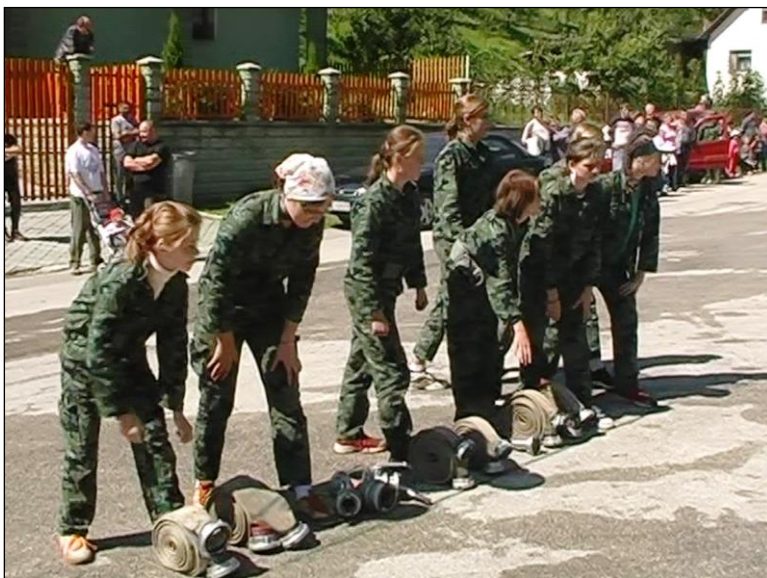
Družstvo žiačok 80. výročie DHZ r. 2005