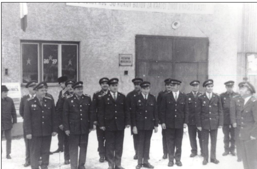
Nástup hasičov v minulosti pred hasičskou zbrojnicou