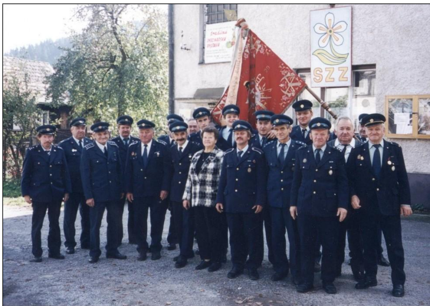
Hasiči rok 2002